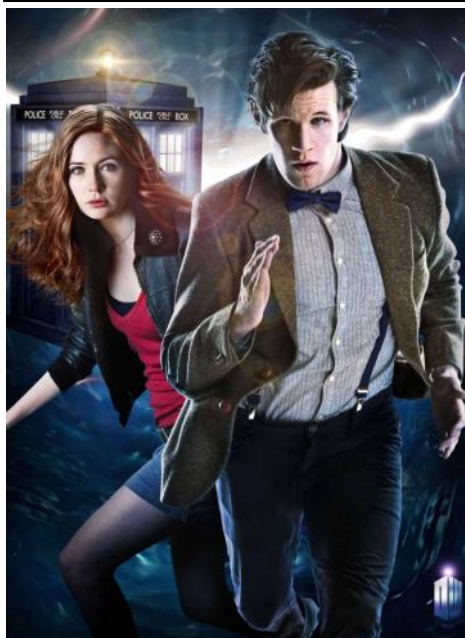
Doctor Who, Matt Smith a Karen Gillan bydd yn cynnwys Goleuadau Nadolig y ddinas