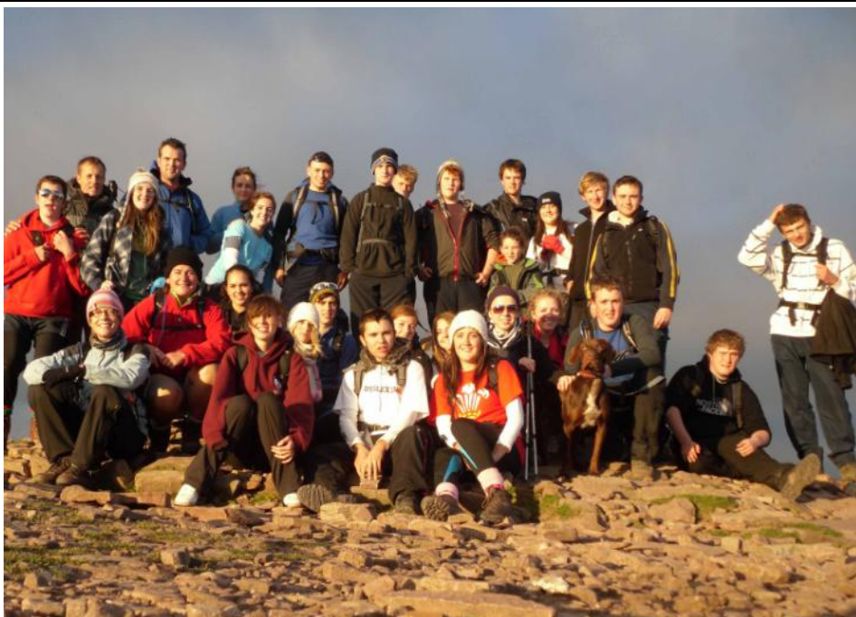
Her y Tri Chopa Ysgol Plasmawr