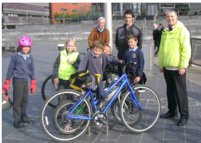
Ysgol Melin Gruffydd yn y Senedd

Cymdeithas Bob Owen FFAIR LYFRAU, CARDIAU ELUSENNOL, MÂN GREIRIAU, RECORDIAU A CDau